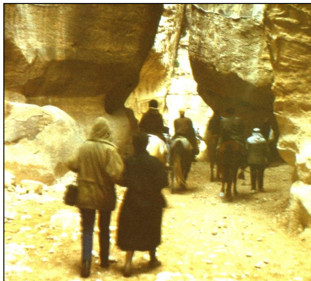
Ozka skalnata razpoka Špik v vadiju Musa

Podobno kot ti nomadi so štirideset let v puščavi živeli tudi Izraelci pod Mojzesovim vodstvom: pred približno 3300 leti jih je popeljal iz egipčanskega suženjstva v smeri proti Kanaanu, v od Boga obljubljeni mu deželo (pozneje imenovano Palestina). Kot je zapisano v Sve-