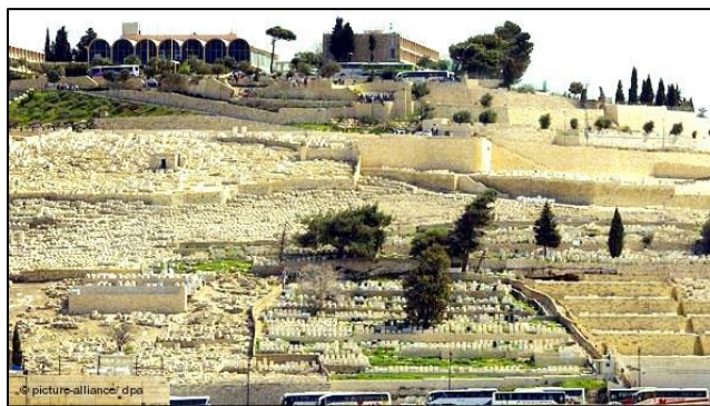
Oljska gora z izjemno velikim judovskim pokopališčem

Kot Samarija se tudi Judeja po prijaznosti pokrajine bistveno ločuje od Galileje, da se človek čudi, kako je