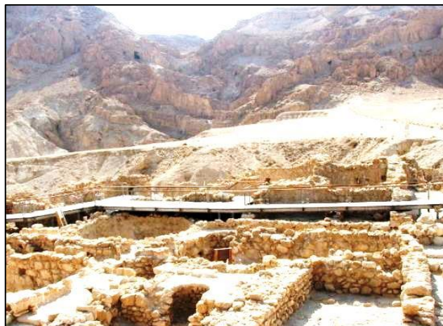
Ostanki Ein Gedija v Qumranu. V ozadju votlina v skalovju, kjer je pastir - beduin našel zvitke Svetega pisma

Okoli 12 km proti jugu ob Mrtvem morju leži v razvalinah Qumran, ki pa ima povsem drugačno zgodovino od Jerihe. Ustanovili so ga eseni – ljudje, ki so iskali samoto in mir v puščavi. Hoteli so živeti popolno življenje, stran od nečistih in pokvarjenih judovskih duhovnikov. Zapustili so torej jeruzalemski tempelj, da bi obnovili zavezo z Bogom pod vodstvom Pravičnega. Prav tako imenovana esenska skupnost se je naselila v