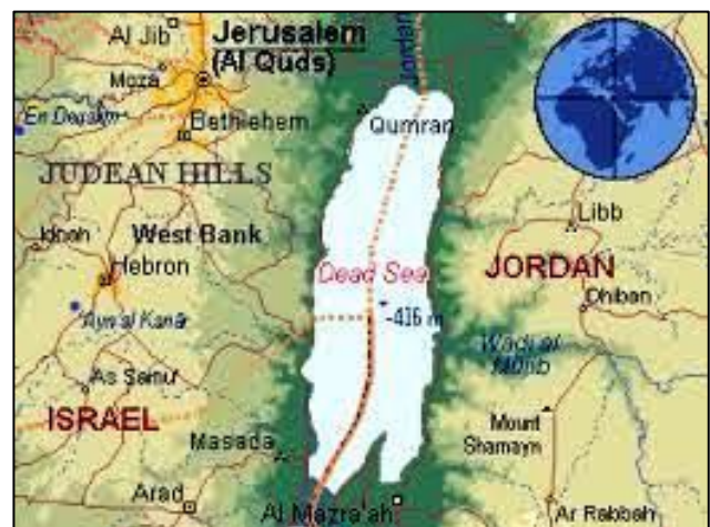
Mrtvo morje leži v depresiji 392 m pod gladino Sredozemskega morja, samo morje, ki je dolgo 80 km in široko 16 km, pa doseže globino 401 m

Preveč bi bilo naštevati vse znamenitosti judovskega, krščanskega in muslimanskega sveta, ki v prenesenem pomenu besede dopolnjujejo ta kraj, kraj, v katerega je treba samo priti, mu prisluhniti in podoživeti njegovo veličastno skr