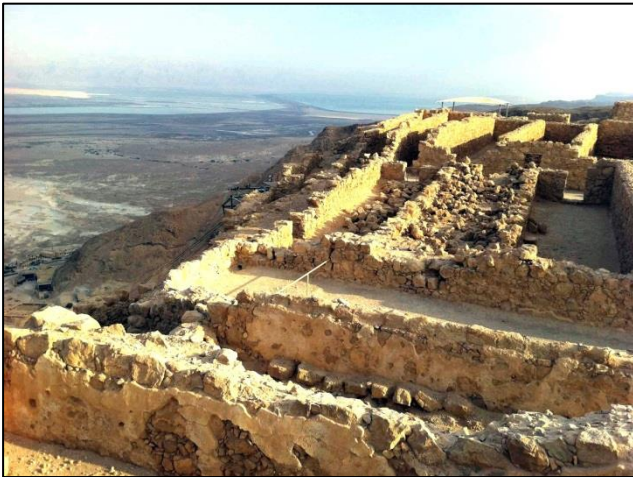
Ko so leta 73 n. št. rimljani po triletnem obleganju zavzeli in uničili Masado, so v njej našli 967 mrtvih branitelje, ki so prostovoljno sprejeli smrt

plitve obale. Kot zanimivost: ko smo prišli iz vode, sploh nismo občutili temperaturne razlike zraka, tako da je bil tudi s te strani občutek edinstven. Edinstven pa je bil tudi zato, ker smo se lahko neomejeno tuširali s sladko vodo, kar je za to področje pravo razkošje.