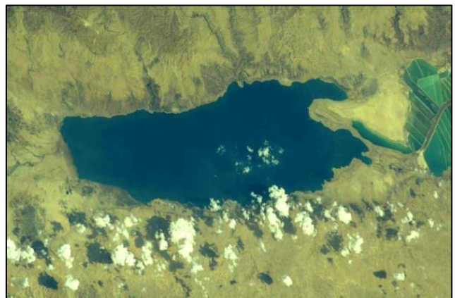
Letalski posnetek 401 m globokega Mrtvega morja, ležečega 392 m pod morskó gladino

Naslednjega dne smo navsezgodaj zjutraj nadaljevali pot proti Jordanskemu jarku oziroma kotlini – to je ozemlje, ki leži okoli 1200 m niže od Amana. Sicer pa se Jordanska planota z Moabskim gorovjem strmo spusti do dna predvsem ob Mrtvem morju, ki leži v depresiji 392 m pod gladino Sredozemskega morja, samo morje, ki je dolgo 80 km in široko 16 km, pa doseže globino 416 m. Vse ozemlje je močno zakraselo, le v Jordanski kotlini pridejo ponekod na dan izviri vode, ki