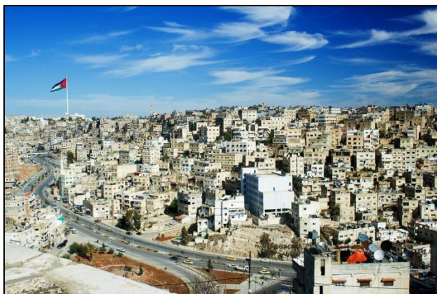
Amman, glavno mesto Jordanije

Ko smo zapustili Aman, moderno mesto z okoli 1,4 milijona prebivalci, kar je dobra tretjina vsega prebivalstva Jordanije, se je planotasti svet, pokrit z redko