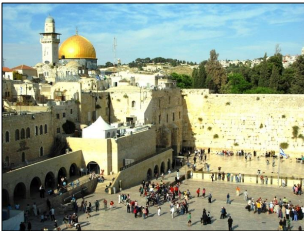
Za Jude je v Jeruzalemu najpomembnejši objekt Zid žalovanja, ob katerem zamaknjeno molijo

Poudarili smo že, da je bila za nastanek mest v Palestini nedvomno največjega pomena voda. In če je bila ta v bližini naravne vzpetine, kakršna je ob griču Ofel,