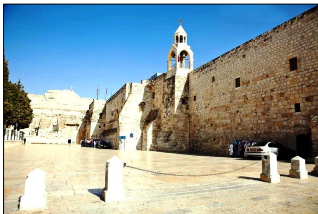
Ko so leta 614 Perzijci na svojem vojnem pohodu prišli v Betlehem ter na freskah v baziliki opazili modre z Vzhoda v oblekah njihovih prednikov, objekta niso uničili - razdejali

Prav Betlehem je Jezusov rojstni kraj in tudi rojstni kraj