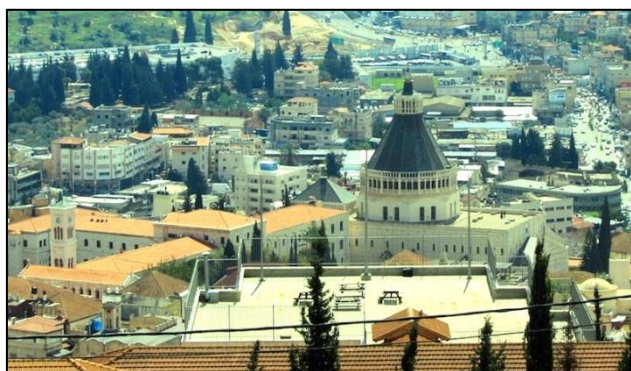
Poleg Jeruzalema in Betlehema je med kristjani danes najbolj v ospredju Nazaret

Nazaret, v katerem je največji del svojega življenja prebival Jezus Kristus, je oddaljen od »Betlehema,« rojstnega kraja Mesije, okoli 150 km. Zanimivo, da Nazareta kot naseljenega kraja oziroma mesta ne omenja nobeno pogansko ali judovsko besedilo pred