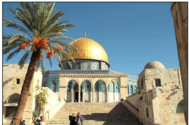
"Mir v tebi, Jeruzalem!" V tebi je živel in oznanjal vero v enega Boga Alaha prerok Mohaned

Podobno kot judom je tudi kristjanom Jeruzalem sveto mesto – sveto mesto po Kristusu, ki je v tem mestu izpolnil v Svetem pismu zapisane mu prerokbe. »Mir tebi, Jeruzalem, ker si bil priča središčnega dogodka zgodovine – trpljenja, smrti in vstajenja učlovečenega sina,« je zapisano v mnogih cerkvenih knjigah. Zapisano je tudi: »Mir tebi, Jeruzalem! V tebi je živel in oznanjal vero v enega Boga Alaha prerok Mohamed. Sveto mesto si našim muslimanskim bratom, ki se navdihujejo ob preroku Jezusu in živijo predano v veri služenja velikemu Bogu. Mir tebi, Jeruzalem!«