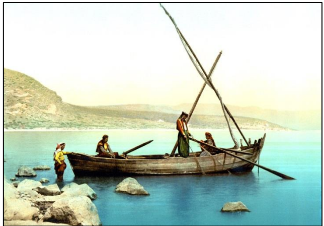
Svetopisemski prizor z Galilejskega jezera

»Če je kje na svetu lepo, potem je to v Galileji,« je zapisal v svoji knjižici eden izmed slovenskih pisateljev. Galileja, ki je od vzhoda do zahoda široka okoli 40 km in se vleče od severa proti jugu kakih 80 km, je torej čisto majhno okrožje, manjše od številnih bivših slovenskih okrajev. Gotovo tudi ni imela v času vladavine Rimljanov več kakor 300.000 prebivalcev (po oceni je imela tedaj celotna Palestina le okoli 1.000.000 prebivalcev). Čeprav je dežela majhna, pa je zelo raznolika: med Zgornjo Galilejo z visokimi gorami ter Galilejo gričev in nižine ob Genezareškem jezeru (jezero, ki leži več kot 200 m pod gladino Sredozemskega morja, je dolgo 21 km, široko pa 12 km in globoko 50 m) so znatne razlike. Dolga ravnina Jezreel, ki se vleče ob zgodovinskem potoku Kison in ob vznožju gorske verige na jugu, se končuje ob Sredozemskem morju na zahodu in Jordanskem jarku na vzhodu. Dežela je bo-