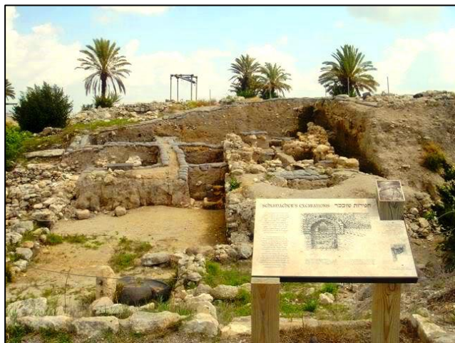
Izkopavanja so pokazala, da je Meggido zelo stara utrdba, po oceni arheologov več kot 5000 let. Podobno kot v Bet Šeanu so tudi tu odkrili več zaporednih kultur

Z Bet Šeana smo nadaljevali pot po ravnini Jezreel, ki se razteza od Jordanskega tektonskega jarka tja do sredozemske luke Haifa na skrajnem zahodnem delu Galileje. Jezreel je največja rodovitna ravnina v Palestini. Z izrednim užitkom smo z avtobusa opazovali plantaže pomaranč, grenivk in limon, ki dozorevajo ravno v mesecu februarju, nadalje številne bazene z